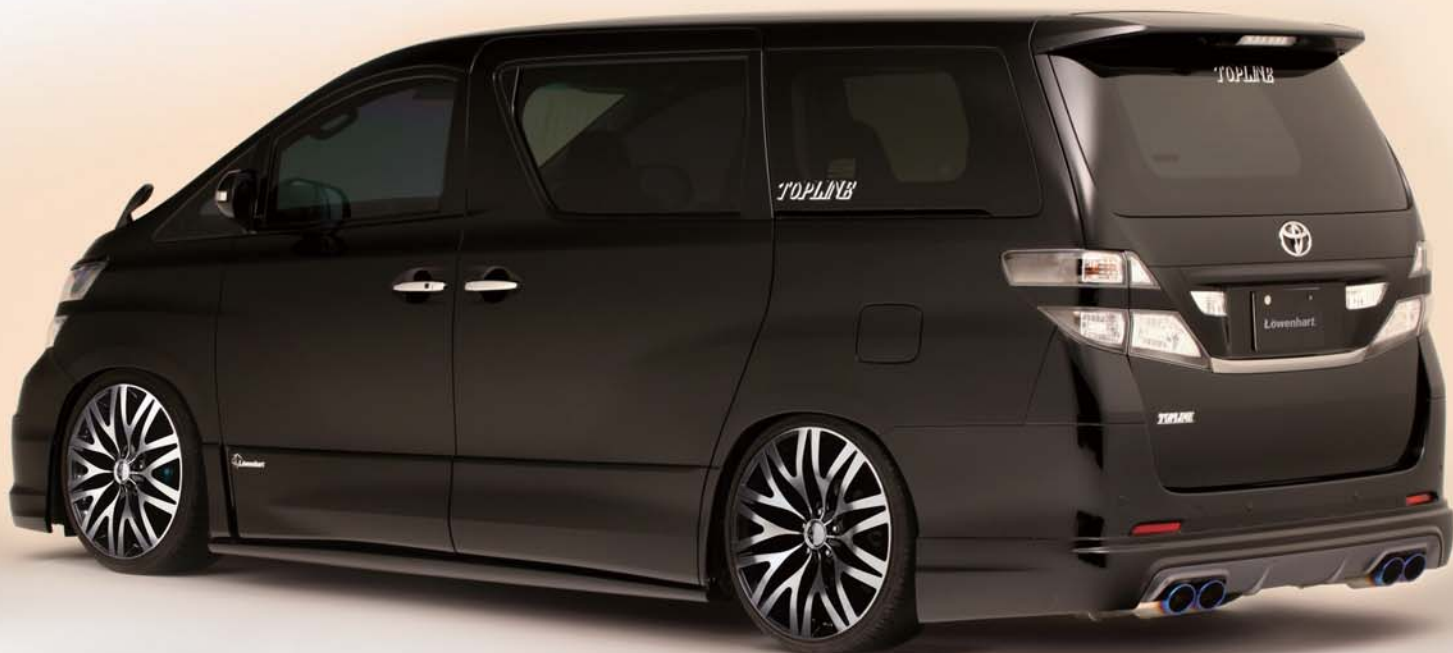
■ FRONT 20 × 9.0 + 39 / REAR 20 × 9.0 + 28 Special Thanks: TOPLINE