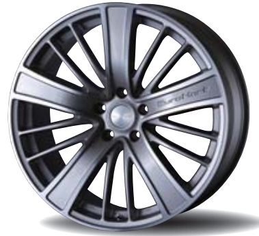
Edge Machining Silver ( 20×9.0J+38 )