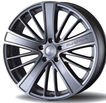
Edge Machining Silver ( 20×8.0J+38 )