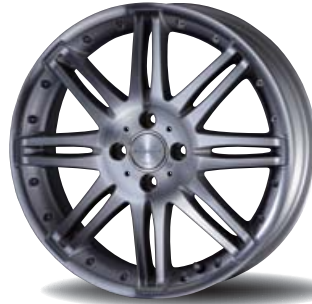
Face Machining Silver ( 17×5.5J+45 )